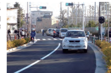
狛江市高校北側付近より世田谷通り方面を望む（撮影日時：平成24年12月1日午後3時）

東京都が整備を進めている調布都市計画道路3・4・17号線の世田谷通り（狛江市元和泉三丁目）から田中橋交差点（同市元和泉二丁目）までの区間、約650mが完成し、12月1日（土）に交通開放しました。これにより、世田谷通りから調布市方面を結ぶ新たな道路ネットワークが形成されるとともに、歩道のない狭い道路への通過交通の流入が解消され、地域の利便性や安全性の向上が図られます。また、災害時の避難場所である都立狛江高等学校や多摩川河川敷への避難路が確保されるなど、防災性の向上が図られます。