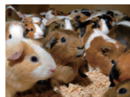
ふれあいコーナーのモルモット

【井の頭自然文化園】 モルモットのふれあいコーナーでは、モルモットをひざにのせて、やさしくなでれば、心まで温かくなることでしょう。ふれあいコーナーで暖かくなったら、冬毛をまとったテンヤタヌキなど、日本の動物たちの「冬の装い」をご覧ください。