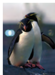
黄色い飾り羽が目印の アイトビペンギン

【葛西臨海水族園】 春から秋は暑さのため屋内施設にいたアイトビペンギンが無事繁殖を終え、オウサマペンギンとともに屋外展示施設に戻ってきます。ペンギン展示施設は一段とにぎやかです。