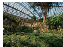
昆虫生態園は別世界

【多摩動物公園】 昆虫生態園は巨大温室。冬でも美しい花が咲き、可憐なチョウが舞い飛びます。肌寒い時期には、特にお勧めです。この他、風邪予防のためにネギを食べるチンパンジー、寒くなると暖をとるためか所に集まって「サルダンゴ」を作るニホンザルなどを見ながら、運動不足解消に広い園内を散策するのはいかがでしょう。