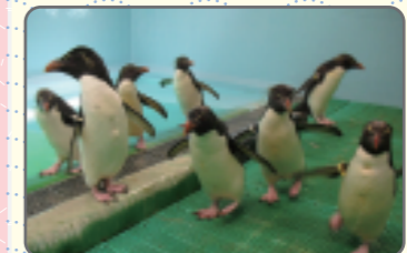
【イワトビペンギン】

一言でペンギンと言ってもその姿かたちや生活する環境、習性など、その違いは様々です。ペンギンは、17種に分類されており、葛西臨海水族園では、キングペンギン、イワトビペンギン、フンボルトペンギン、フェアリーペンギンの4種を飼育しています。寒いところで暮らす動物というイメージの強いペンギンですが、実は暖かい地域で暮らす種類も多く、中には赤道直下で暮らすものもいるほどです。当園で飼育しているフンボルトペンギンとフェアリーペンギンは暖かい地域で暮らし、キングペンギンとイワトビペンギンは南極周辺の寒い地域で暮らすペンギンです。南極の周辺で暮らすペンギンたちにとって、東京の夏の暑さは、過酷そのものです。また、夏と繁殖の時期が重なってしまうため、親鳥にとっても生まれてくるヒナにとっても良い環境とは言えません。そこで、葛西臨海水族園では、これらのペンギンたちが夏を健康な状態で乗り切れるように、5月上旬から10月下旬頃にかけての約半年間、屋外の施設から屋内の冷房室に移して飼育をしています。まだまだ暑さは続きますが、ペンギンたちが待ちに待った季節は一步一步近づいてきています。近々、広い陸地や大きなプールでのびのび動き回る元気な姿を見せてくれることでしょう。