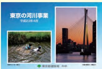
≪平成22年度入賞作品の使用例≫ 東京の河川事業パンフレット

宛先：〒163-8001 東京都建設局河川部まちフォトコン係 ml-kawaphoto23@section.metro.tokyo.jp 締切：平成23年6月15日(水)(必着) その他：未発表・未応募のものに限ります。 作品の返却はいたしません。 著作権は本人に帰属しますが、東京都が広報誌等に無償で使用させていただきます。