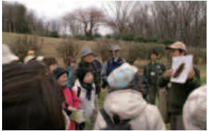
昨年度、自然ガイドの様子 ▲