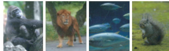
恩賜上野動物園 多摩動物公園 葛西臨海水族園 井の頭自然文化園

Visit Zoo キャンペーンとは 都立動物園・水族園の魅力とサービス向上のため、動物の魅力を引き出す展示施設の整備、飼育体験など体験型イベントの拡大、開園時間の延長と開園日数の拡大、ユビキタス(携帯端末)を利用した園内情報サービスの提供など、様々な取り組みを行うものです。