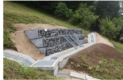
地すべり防止施設