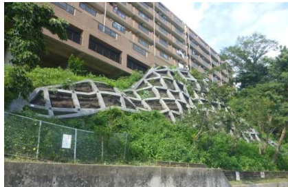
急傾斜地崩壊防止施設