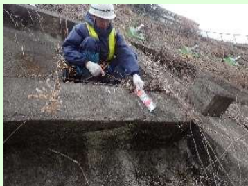
目視点検実施状況

従来の目視点検に加え、カメラ・レーザを搭載したUAVを使用し、写真計測や点群データを取得することで、施設外観の状況を調査